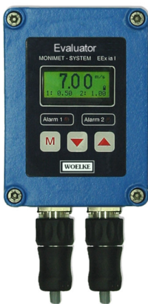
Auswertegerät Typ GMM 30.00.5xx im Metallguss-Gehäuse