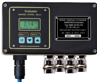
Auswertegerät Typ GMA 30.00.7xx