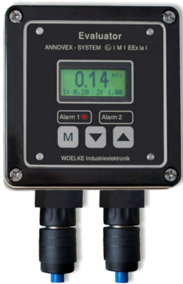
Auswertegerät Typ GMA 30.00.5xx